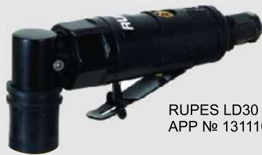
RUPES LD30 APP № 131110